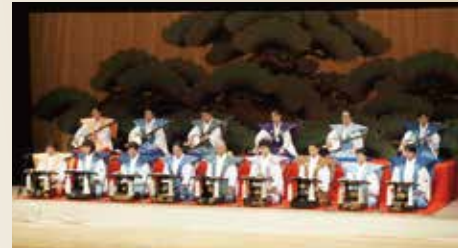
喜笑会/城北会/友輔会 友和喜会/友成会

曾根崎心中ー絵本太功記ー生写朝顔日記ー傾城阿波の鳴門人形浄瑠璃の名作さわりメドレー集。徳島の名人達が集う。